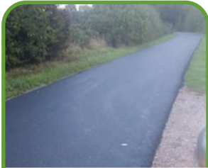
Ste-Marguerite-de-Viette Chemin du Bois du roi