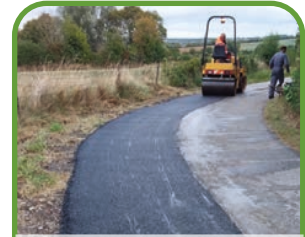
Hiéville purge Rue du clocher