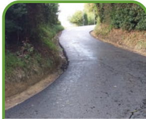
St-Martin-de-Fresnay Chemin des Quatre Nations