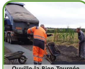
Ouville-la-Bien-Tournée purge Impasse de la Haie fleurie