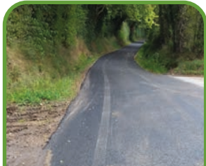
Vieux-Pont-en-Auge Route des Coutures

Des travaux d'enrobé ont été réalisés depuis le mois de septembre dans les secteurs suivants :