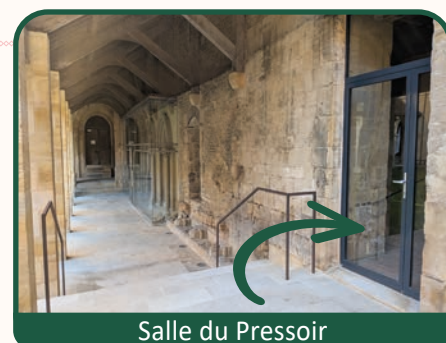
Salle du Pressoir

Début 2026, vous pourrez découvrir les 13 peintures murales qui seront exposées dans la salle du Pressoir.